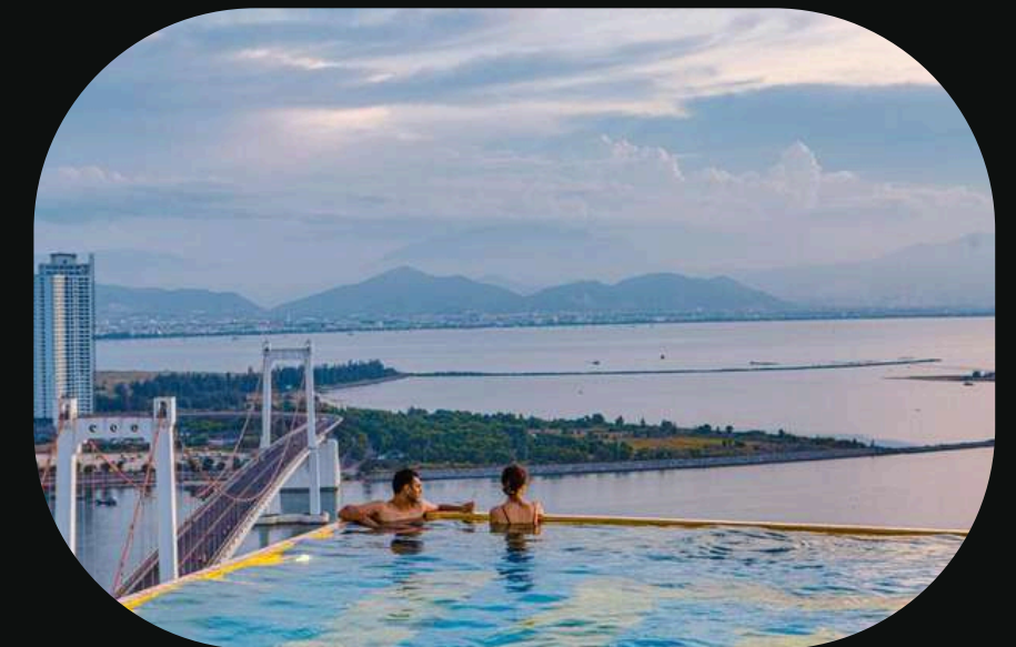
Wyndham Golden Bay Da Nang