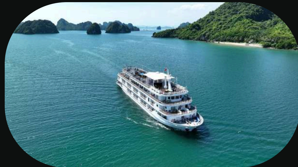
Paradise Grand Cruise