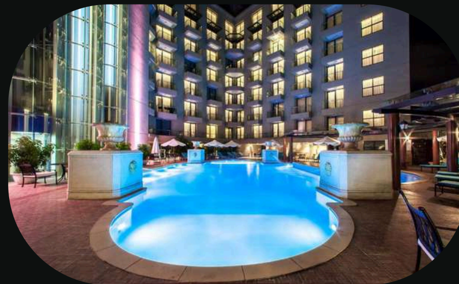
Army Hotel Hanoi