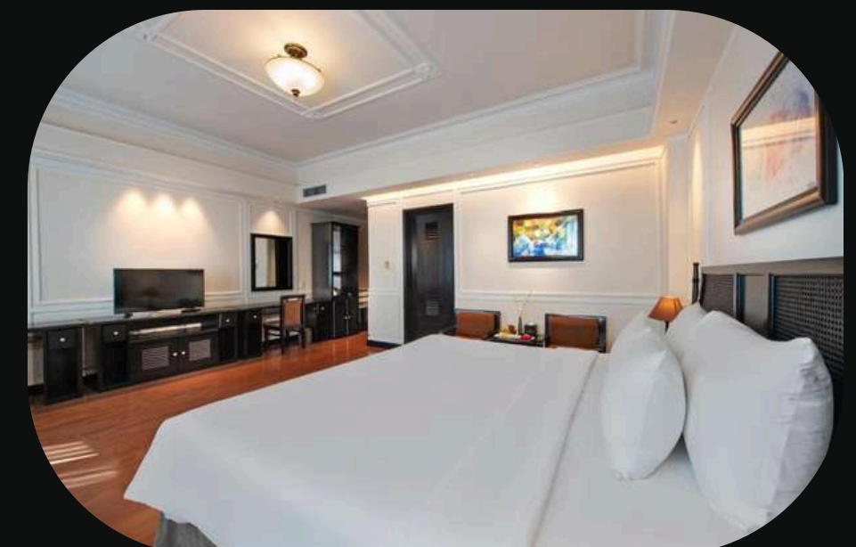
Legend Ninh Binh Hotel