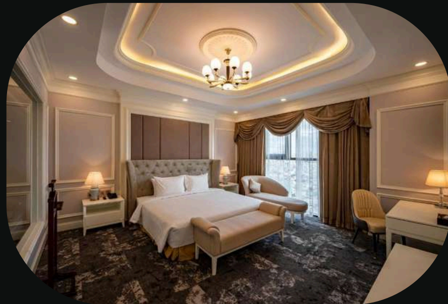
Muong Thanh Luxury hotel Saigon